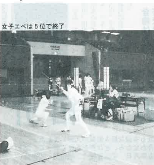
女子エペは5位で終了