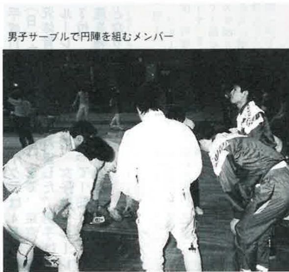
男子サーブルで円陣を組むメンバー