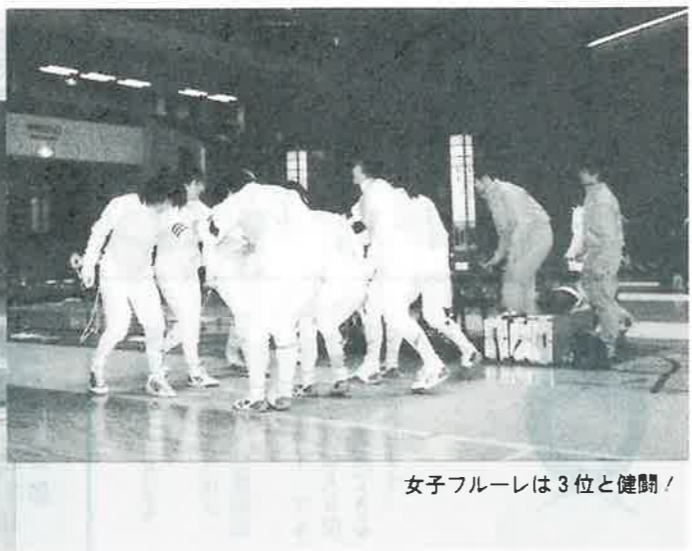
女子フルーレは3位と健闘!